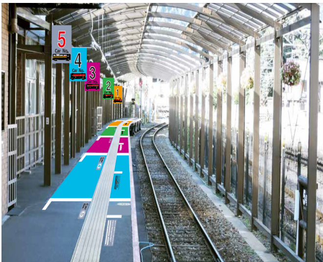
【トロッコ嗟峨駅ホーム】