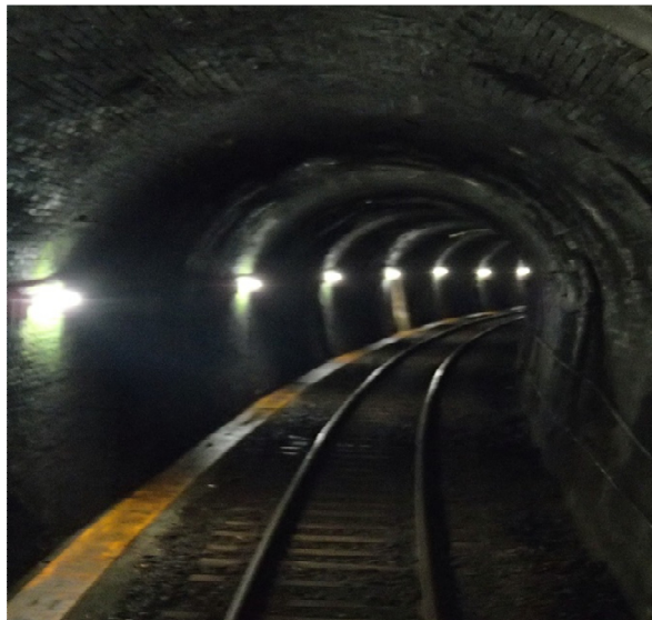
【実施後】(29箇所 LED 化と通路整備)