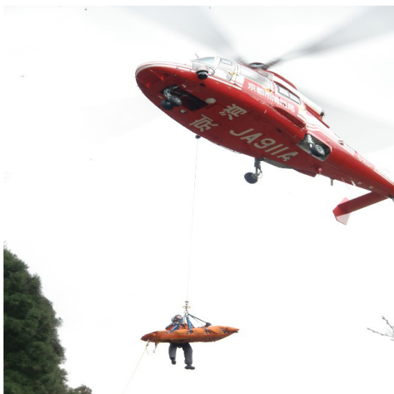
【重傷者のヘリコプターでの搬送】