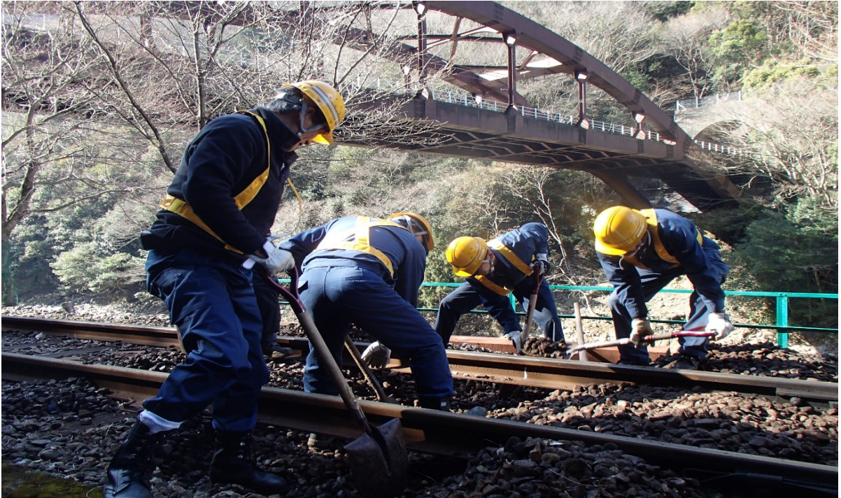
【まくらぎ交換の様子】(2k600m)